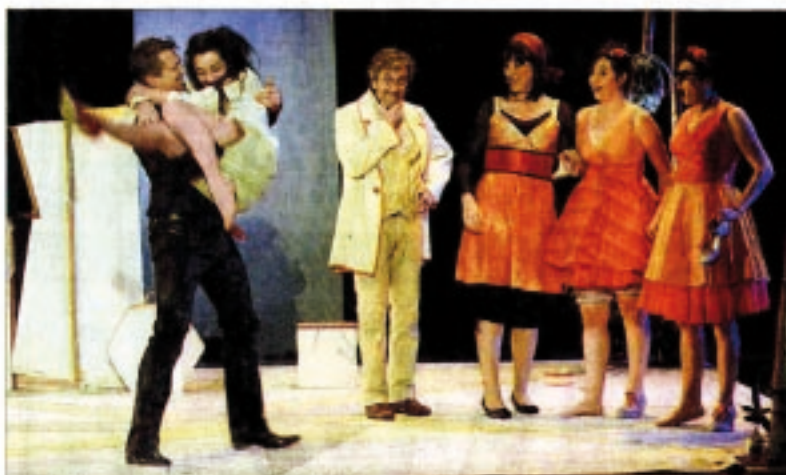
■ Cendrillon moderne évolue au sein de familles recomposées...

Mais hier dimanche, on aurait pu passer tout l'après-midi salle Poiré, avec le dernier jour de l'expo Le Feu sacré réunissant de artistes contemporains du verre, dans la galerie Poiré et dans les coursives de la